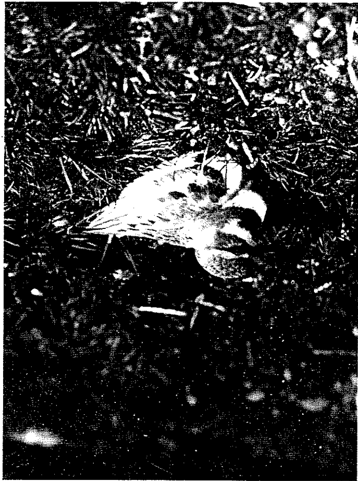
BANDED DOTTEREL on nest